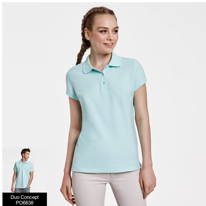
Duo Concept PO6638