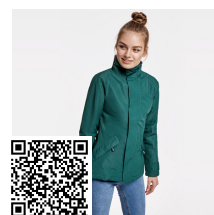
EUROPA WOMAN PK5078