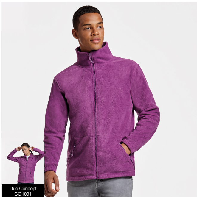
Duo Concept CQ1091