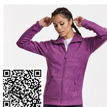
PIRINEO WOMAN CQ1091